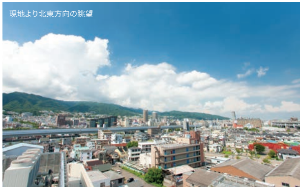
現地より北東方向の眺望

◎費用やサービス内容について詳しくご案内いたしますので、下記電話番号にお問い合わせください。