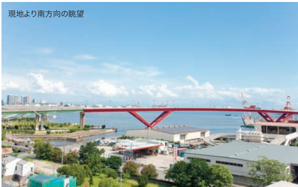
現地より南方方向の眺望