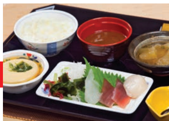
旬の素材を取り入れながら、一人ひとりの健康状態にあわせて、おいしい料理を提供しています。(写真の食事は一例です)

ゲストが持っている慢性疾患をコントロールし、重大な病気の予防および病気の早期発見、地域医療機関への連携をおこなっています。また、生活の場におけるゲストの相談にも応じます。ゲストや家族の意向を尊重し、その方にとってふさわしい医療とは何かを模索しながら、安心して暮らしていただけるためのサポートをしていきたいと考えています。