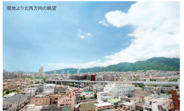
現地より北西方向の眺望

■類型/ケアハウス(一般型特定施設入居者生活介護) ■利用料の支払方法/居住に要する費用 分割払い ■介護居室区分/全室個室 ■入居時要件/要支援・要介護 ■介護に関わる職員体制/入居者:スタッフ=2:1 ■その他上記に含まれないサービス/理美容サービス・週3回目からの入浴料金・金銭・預貯金および貴重品の管理・レクリエーション活動・日常生活・利用者の移送に係る費用 ■介護保険/兵庫県指定介護保険特定施設入居者生活介護(一般型) ©ロングステージKOBED大石概要 ■所在地/神戸市灘区大石南町2-4-22 ■阪神電車「大石駅」徒歩約8分(600m) ■構造・規模/鉄筋コンクリート造・地上8階建 ■総居室数/90室 ■募集居室数/90室 ■土地・建物の権利形態/社会福祉法人鶯園所有、土地借地 ■総敷地面積/3,053.63m 2 ■建築延床面積/6,072.29m 2 ■居住専有面積/21,000m 2 ■建物竣工/平成21年4月 ■事業主/社会福祉法人鶯園 ■開設/平成21年7月 ■設計管理/株式会社アクト建築事務所 ■施工/株式会社奥村組 ■広告有効期限/2020年3月末日